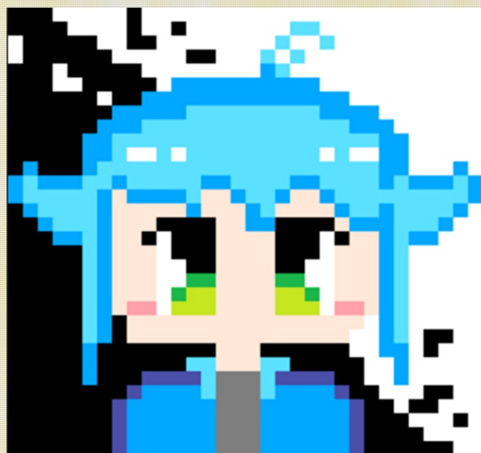
obrázok by Nika Engelwood

Vyrobila RR časopisu Cooloviny v spolupráci so žiakmi ZŠ Špačince